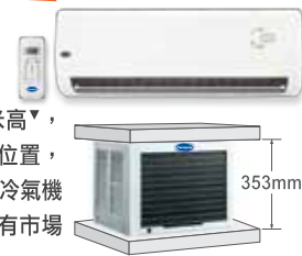
▽適用於 TW-10SX / TW-10SAX

肯特窗口式分體機，室外機只有353毫米高，尺寸與窗口機相若，可輕易擺放於窗台位置，省卻安裝費用及時間。運作比傳統窗口式冷氣機更寧靜，最適合睡房及書房使用。更備有市場少有2.5匹大製冷量型號。