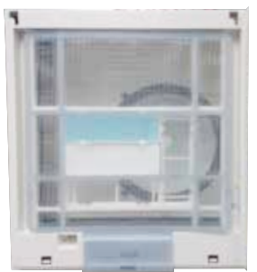
三合一防蟎·溶菌酶除塵過濾網